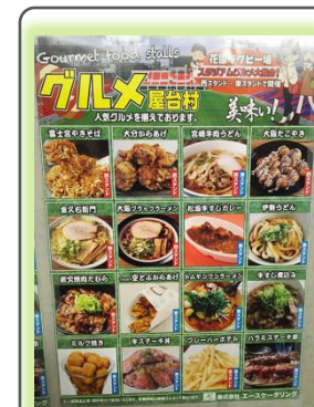
花園ラグビー場の例

幅広いレベルのゲームで実現 (リーグワン、大学、高校、その他ラグビーイベントまで)