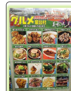
花園ラグビー場の例

トップリーグに関わらず幅広いレベルのゲームで実現 (大学、高校、その他ラグビーイベントまで)